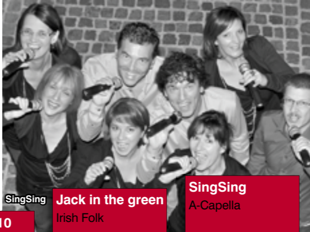
Jack in the green Irish Folk