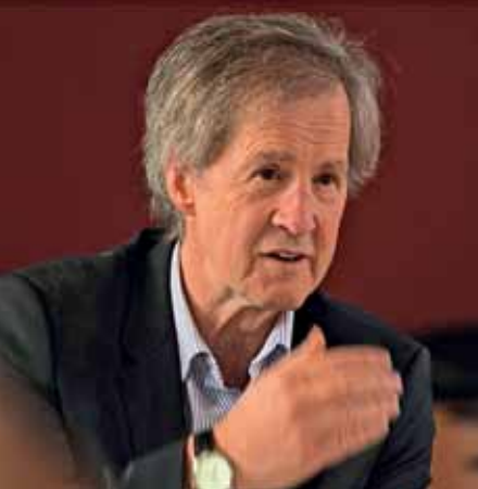
Jo Leinen, Mitglied des Europäischen Parlaments

Der ehemalige saarländische Umweltminister und Klimaexperte im Europaparlament hat an mehreren Weltklimakonferenzen teilgenommen. Er hat das Kulturforum Köllertal e.V. bei der Entwicklung des innovativen Klimaschutzprojekts der Gläsernen Baustelle Bahnhof Püttlingen als Projektberater unterstützt. In seinem Vortrag behandelt er den Klimawandel und seine Auswirkungen weltweit und in unserer Region. Er beantwortet Fragen wie: Warum muss der Klimawandel gestoppt oder zumindest gedämpft werden? Was sind die Ursachen? Welche Maßnahmen sind zum Klimaschutz notwendig? Was hat die Energiewende mit dem Klimawandel zu tun? Was kann jeder Einzelne für den Klimaschutz tun?